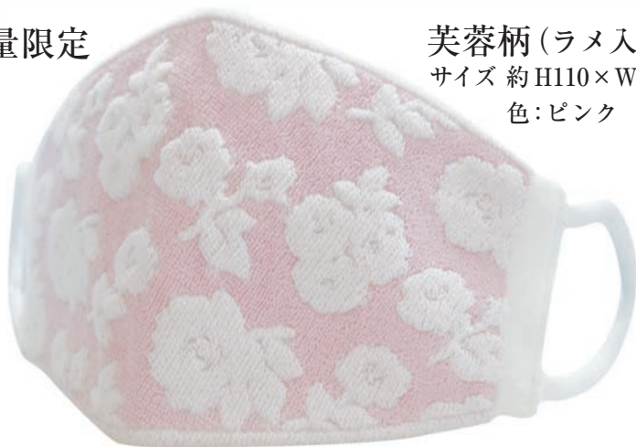
芙蓉柄 (ラメ入) サイズ 約H110×W210 色: ピンク