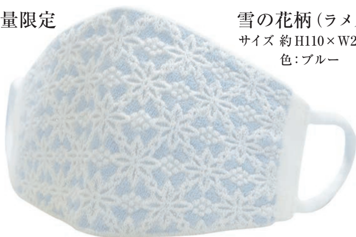
雪の花柄 (ラメ入) サイズ 約H110×W210 色: ブルー