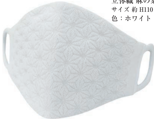
立体織 麻の葉柄 ラメ入 サイズ 約 H110×W200 色：ホワイト・ピンク

シルクのうるおいと 天然シルクから抽出された高純度シルクプロテインと 銀のパワーが融合 安全高品質抗菌性ナノ銀をマスク全体にコーティング