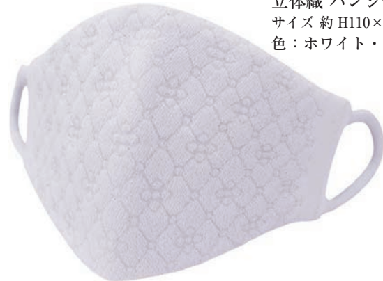
立体織 パンジー柄 ラメ入 サイズ 約 H110×W200 色：ホワイト・ピンク