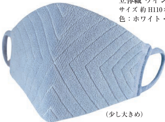
立体織 ウイング柄 ラメなし サイズ 約 H110×W220 色：ホワイト・ブルー