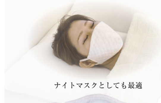
ナイトマスクとしても最適

のどの乾燥を防ぐナイトマスクとして、またスポーツなどでの使用にはちょっと大きめサイズのウイング柄がおすすめです。