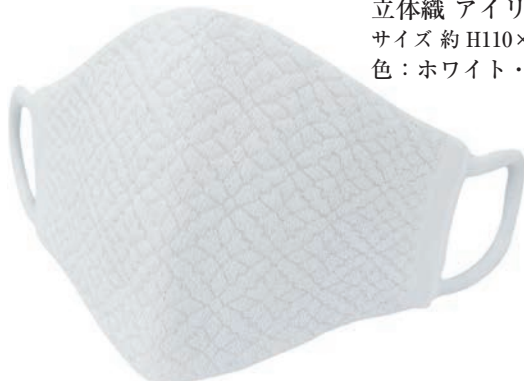
立体織 アイリス柄 ラメ入 サイズ 約 H110×W200 色：ホワイト・ピンク